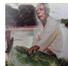
Kemana gha Istana Bendi di Pulau Ma