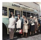
Laluan bus terpanjang dalam sejarah