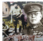
Sultan Sir Ibrahim tamatkan anugerah pak belangan Samsu