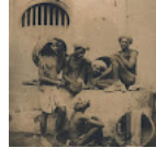
Buruh India di Bombay pada kolonial Brit sekitar 1860