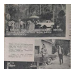
Liputan filem Mervuaku