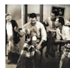
Ajis dan Sud pernah dihal Ramlee