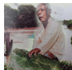
Kemana ghaib Istana Bendahara di Pulau Melayu