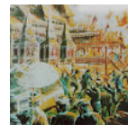
Tragedi keba istana Sultar Shah