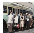
Laluan bas terpanjang c sejarah