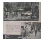
Liputan filer Mertuaku