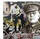
Sultan Sir Ib tamatkan an pak belang c Samsu