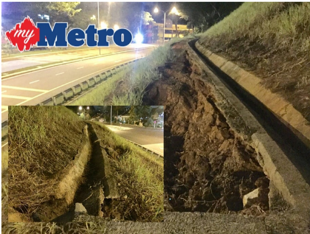
Rekahan di tebing Jalan 11/55C, Puncak Setiawangsa, Bukit Setiawangsa.

BERLAKU rekahan di tebing Jalan 11/55C, Puncak Setiawangsa, Bukit Setiawangsa, iaitu lokasi sama berlakunya kejadian tanah runtuh hampir lima tahun lalu.