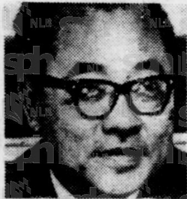
KHAW KAI BOH

"Dengan p e m b e n a a n 42,000 rumah pangsa yang perengkat pertamanya akan siap dalam tiga tahun lagi, saya berharap semua penduduk rumah2 haram akan berpindah ka-rumah2 baru itu."